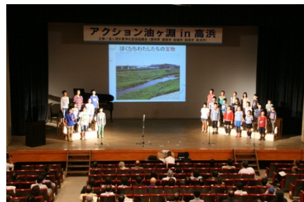
高取小学校ひえ田川クラブ