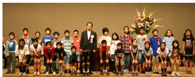
高取小学校ひえ田川クラブ