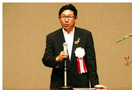
高浜市長 吉岡 初浩